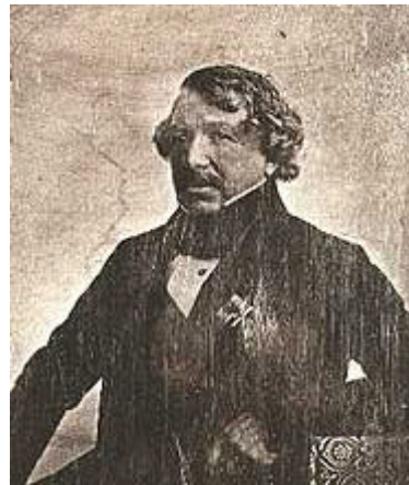
DAGUERRE Jacques Louis Mandé 1787-1851

Konstnär, scenograf, uppfinnare. I samarbete med Charles Bouton uppförde han ett diorama vid Place du Chateau i Paris. 1826 informerade optikern Charles Chevalier honom om den uppfinningen som Niépce sysslade med sen 1816 - denna hade nämligen lyckats åstadkomma en fotografisk bild. Efter långa förhandlingar slog sig de båda uppfinnarna sig samman för att utveckla Niépces forskningsresultat. I kontraktet förband sig Niépce att anförtro Daguerre "alla detaljer om sitt förfarande" och Daguerre å sin sida att avslöja för sin kollega "alla förbättringar av kameran som han åstadkommit".